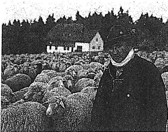
Mit Prämien für Landschaftspflege wird das Schafehüten rentabler

Weide: Eigentlich brauchen Schafe gar keinen Stall. Wegen ihrer