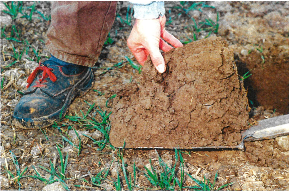
Mit der Spatendiagnose lässt sich die Bodenfruchtbarkeit schnell und einfach bewerten.

Die Bodenfruchtbarkeit ist ein zeitloses Thema und Ruschs Wissen keinesfalls verstaubt.